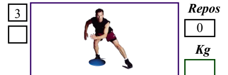
Pas de patin + DS + 5 Kg