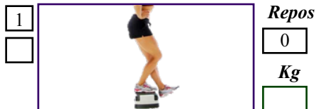
Descente EXC 4''