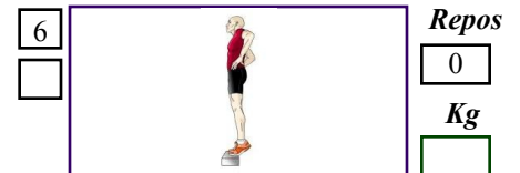
Extension chevilles en équilibre