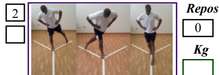
Le''Y'' avec cônes + one leg squat